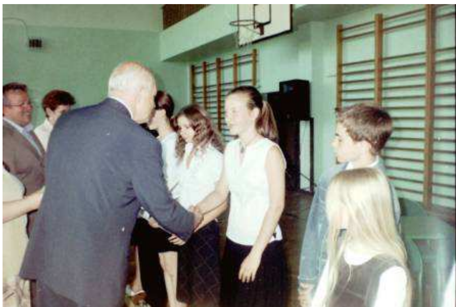
Finale Wojewódzkiej Gimnazjady w Szkolnej Lidze Lekkoatletycznej i drużyny chłopców w Sztafetowych Biegach Przełajowych.