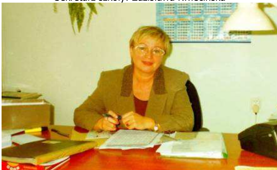
Nauczyciele uczący w roku szkolnym 2004 / 2005: